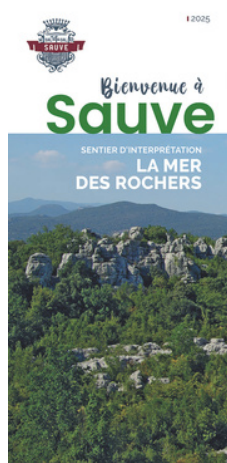
Sentier Mer des rochers