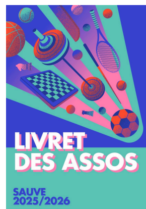
Livret des assos