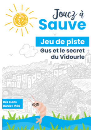
Jeu de piste "Gus et le secret du Vidourle"