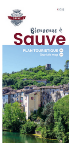
Plan touristique de Sauve (Français / Anglais)

L'OT s'engage dans une démarche locale en imprimant ses supports localement.