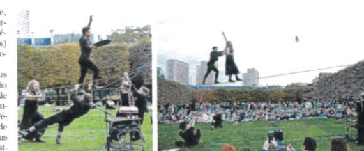
« Faire de l'art funambule une discipline collective plutôt qu'individuelle en faisant participer le public... »

En quelques années, l'association L'Oktopus et son noyau d'une cinquantaine de bénévoles ont réussi à fédérer plus de 600 adhérents, autour d'événements récurrents comme le festival Okto Maerte et le Bal Poupulaire. Réunie aujourd'hui sous le nom unique de Basinga, la compagnie prend en main la direction artistique du projet : « Basinga travaillera en lien étroit avec un