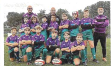
Les M12 n'ont pas démerité sur la pelouse de St Quentin La Poterie.

L'ambiance était au beau fixe sur le stade Robert Gaillard malgré une pluie incessante samedi 12 octobre. 102 jeunes, garçons et filles, étaient réunis pour le premier tournoi à XV des M14. Après s'être échauffés et restaurés grâce au déjeuner organisé par le club sauvain, les jeunes joueurs se sont affrontés autour du ballon ovale, les filles (encore