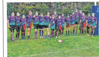
Heureux, les M14 du RCPC ont fait carton plein au stade Robert Gaillard.