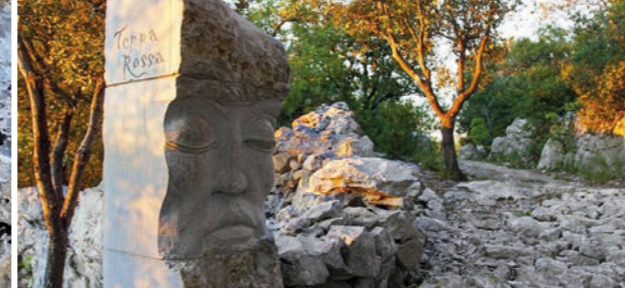
La porte des secrets