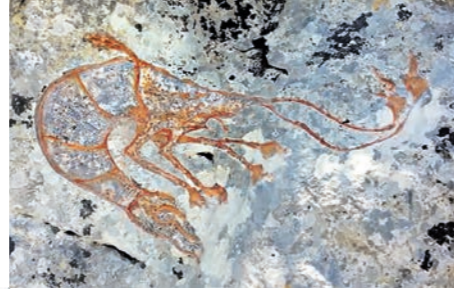
Une "crevette de pierre" dans une mer de roches...

⚠️ Portions caillouteuses nécessitant une bonne motricité. Pensez à prendre de l'eau et bien vous chausser.